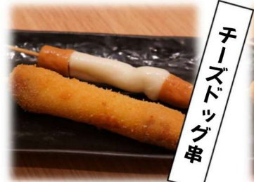
チ ーズ ド リ ン グ 串