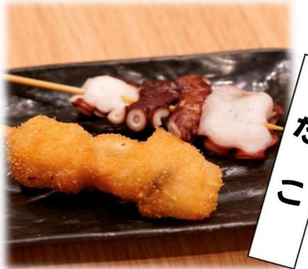
た い り