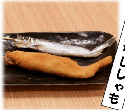
子 持ち が っ て い っ て き ゃ ん