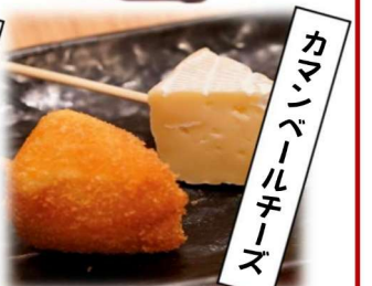
カ ム ン ブ ル チ ーズ