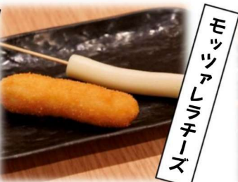
ホ ル マ ン チ ーズ