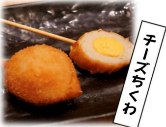
チ ーズ ガ へ わ