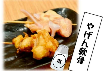
や げ ん 軟 骨