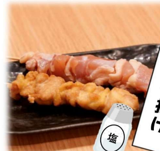
鶏 か ら 揚 げ