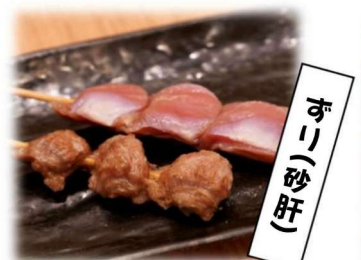
す こ (砂 肝)