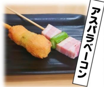
アスパラベーコン