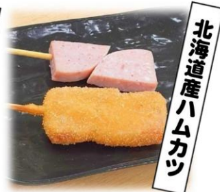
北海道産ハムカツ