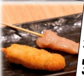
さしみガーリック