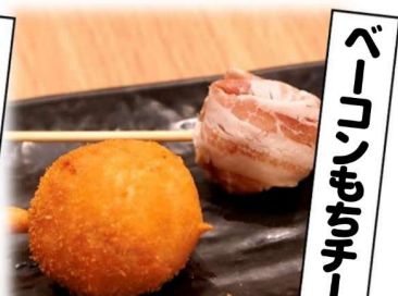
ベーコンもちチーズ