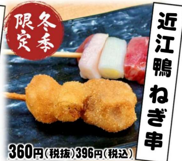
近江 鴨 ねぎ串