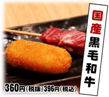
国産 黒毛 和牛