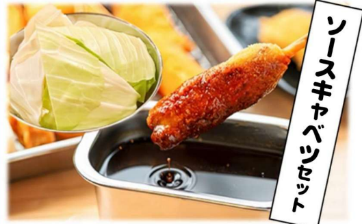
シロネ キャベツ トッピング コロッケ