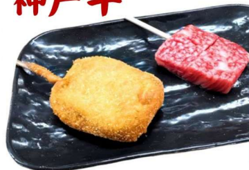
Kobe Beef ¥680 (税込748円)