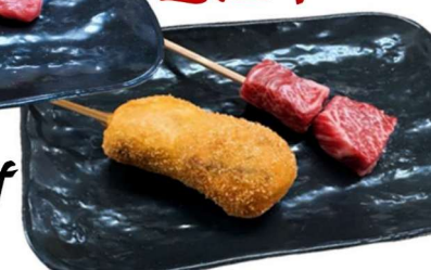
Omi beef ¥650 (税込715円)