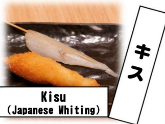
Kisu (Japanese Whiting)