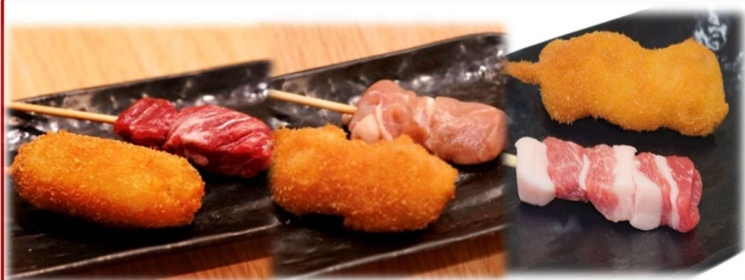
Premium Kuroge Wagyu Beef ¥360 (税込396円)