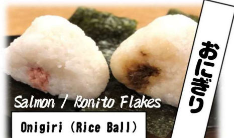
Salmon / Bonito Flakes Onigiri (Rice Ball)