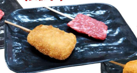
Matsusaka beef ¥680 (税込748円)