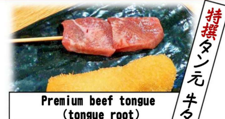
Premium beef tongue (tongue root)