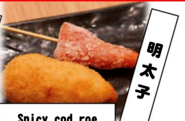
Spicy cod roe