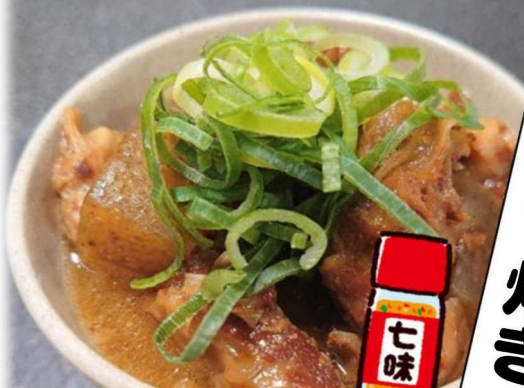
Osaka Specialty Doteyaki