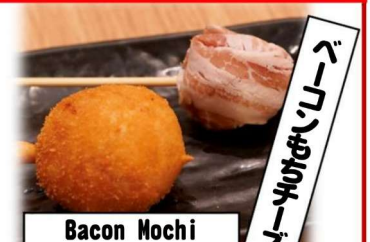
Bacon Mochi Cheese